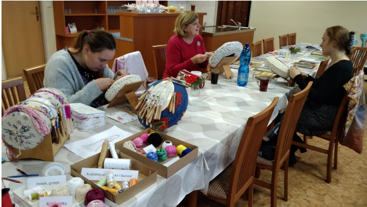
Paličkování v Oldřichovicích