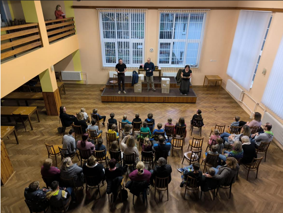
Pošťácká pohádka v Karlovicích