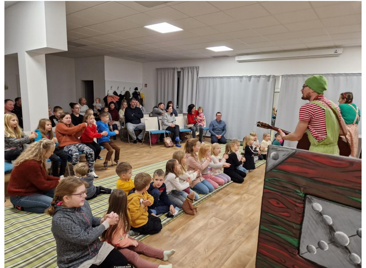
Divadélko z truhlice ve Veselé