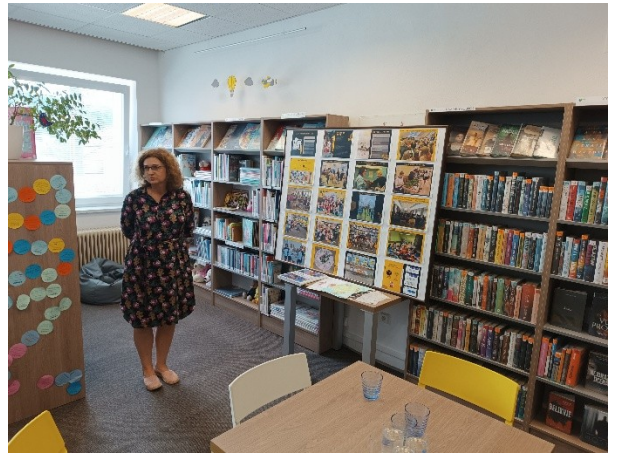
Místní knihovna Dolní Lhota