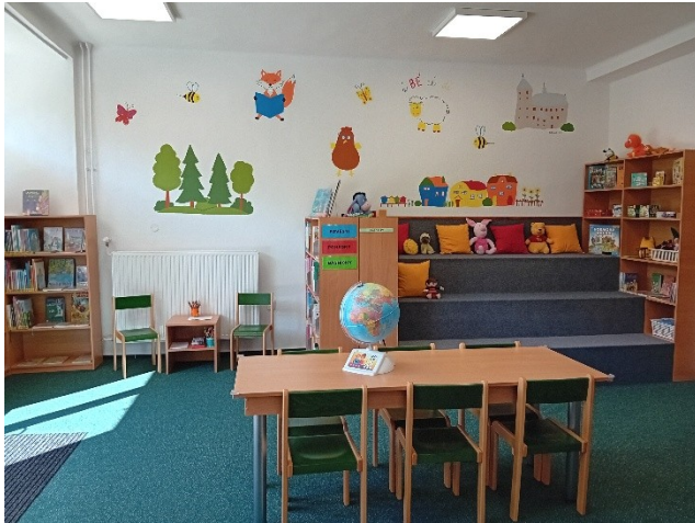
Obecní knihovna Rajnochovice