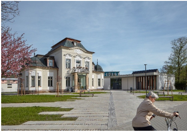
Městská knihovna Rožnov pod Radhoštěm