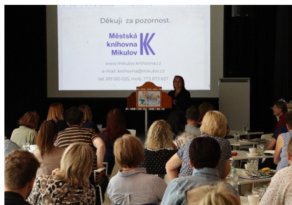
Seminář pracovníků profesionálních knihoven ZK