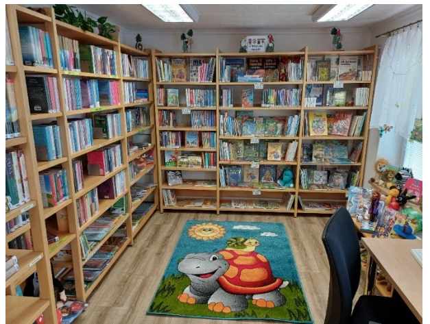
Místní knihovna Horní Němč