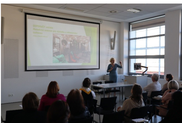
18. setkání starostů obcí a knihovníků okresu Zlín